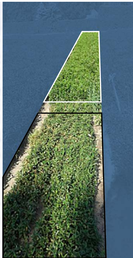
Perceel Overijssel mei 2015