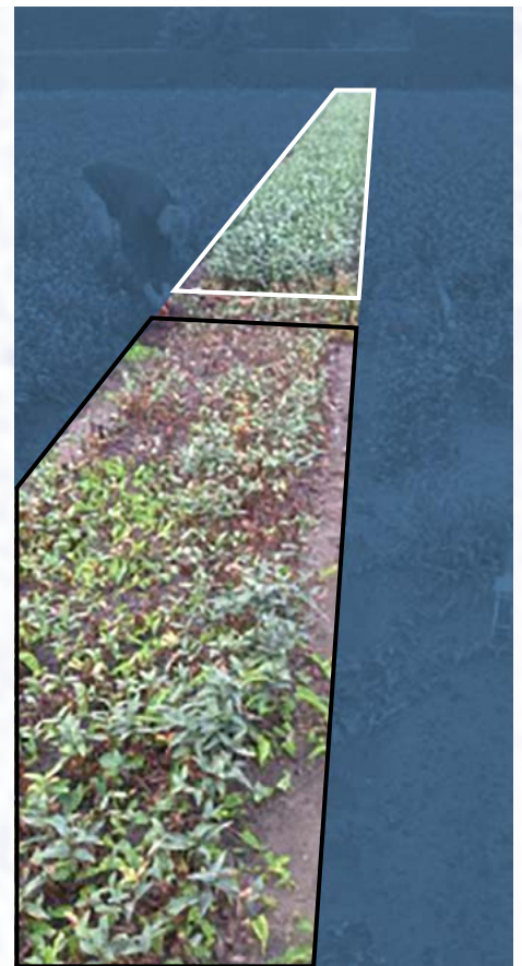
Perceel Overijssel september 2015